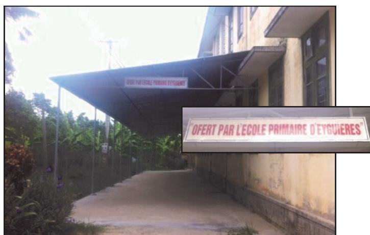
Le hangar à vélo construit pour les écoliers Vietnamiens grâce au projet solidaire.

Retrouvez l'intégralité du projet, des images, des vidéos sur le site des AIL :