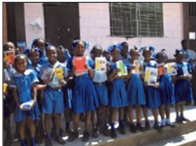
Les enfants du Vietnam et d'Haïti tenant le livret réalisé par les élèves d'Eyguières