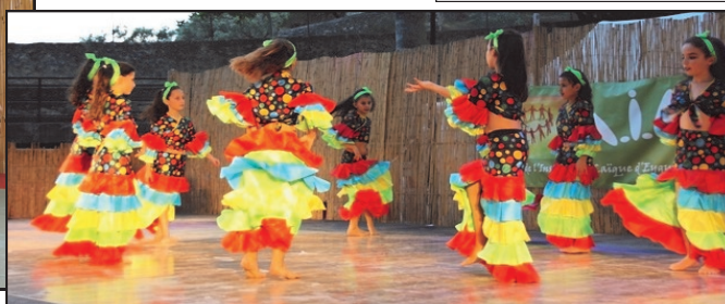
Fête des AIL aux arènes

Retrouvez l'ensemble des activités, des projets, la fête des AIL. en images et vidéo, toutes les informations utiles, sur le site des AIL : http://ail-eyguieres.org