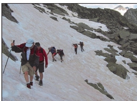
Rando dans le Valgaudemar