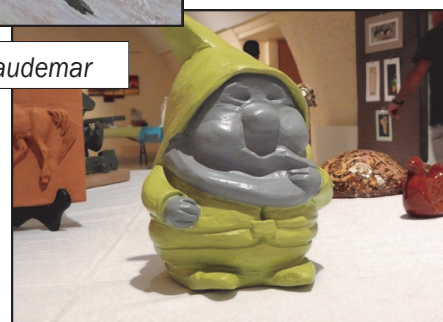
Expo. sections artistiques