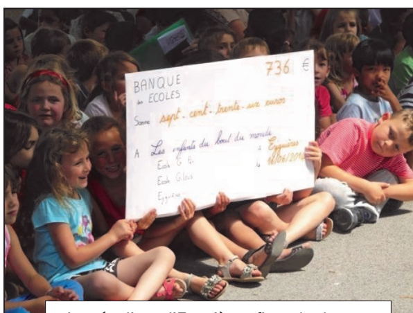
Les écoliers d'Eyguières fiers de donner leur chèque de solidarité