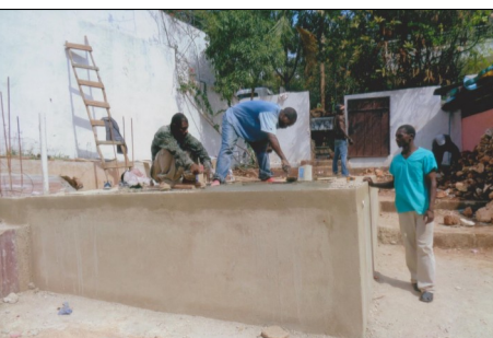
La citerne de l'école construite grâce aux dons des écoliers d'Eyguières